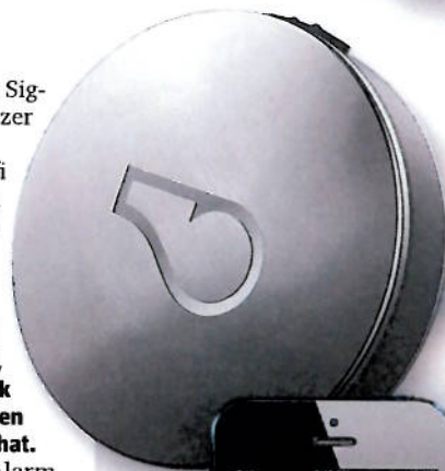
Vom Halsband aufs Smartphone Die Bewegungen des Hundes werden auf einer App aufgezeichnet.

Das Tracking-Halsband für Hunde gibts ab kommenden Herbst. Der Preis dürft bei rund 100 Franken liegen. ●